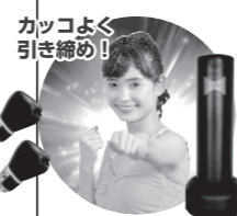
カッコよく引き締め！