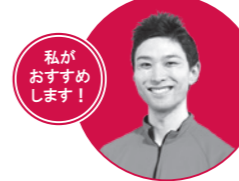
私がおすすめします！